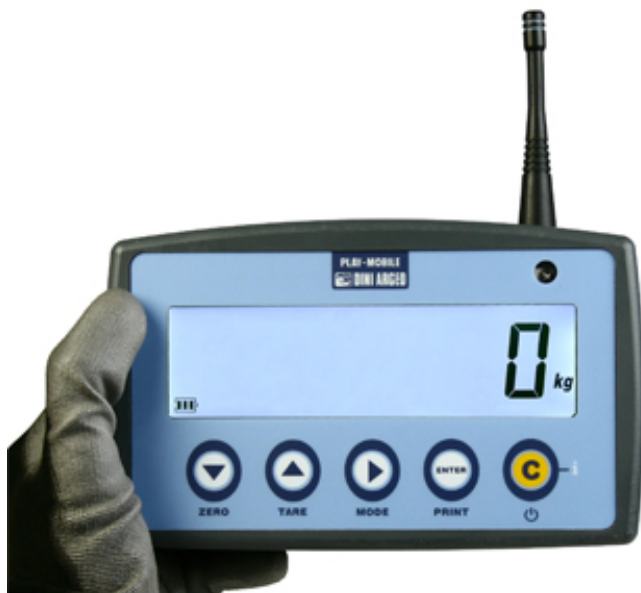
Repetidor de peso en radiofrecuencia para visores serie DFW y dinamómetros serie MCW.