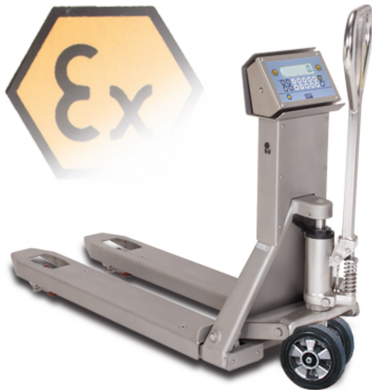
TPWX3GDI Transpaleta pesadora en acero inoxidable, para zonas con riesgo de explosión

Transpaleta con pesaje electrónico integrado, adecuada para áreas peligrosas clasificadas como zonas con riesgo de explosión (ZONA 2 y 22) con modo de protección según Ex II 3GD IIC T6 T130°C X. La detección del peso por 4 células de carga de acero inoxidable IP68 con certificado Atex, garantiza la máxima precisión en cualquier condición de trabajo. Estructura completamente de acero inoxidable. Disponible también en versión HOMOLOGADA CE-M.