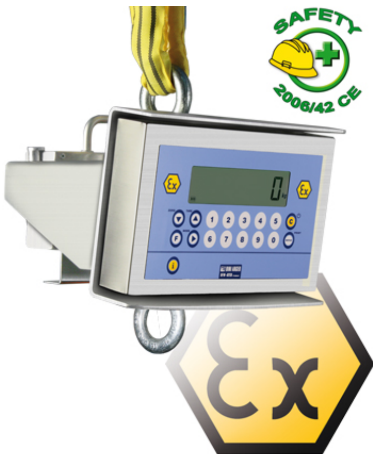
MCWX2GD con eslabón de unión y gancho giratorio opcional

Ganchos pesadores para aplicaciones de pesaje en zonas clasificadas con riesgo de explosión (Zonas 1 y 21, 2 y 22) con modo de protección según Ex II 2G IIC T4 T197°C X. Estructura totalmente en acero inoxidable, con grado de protección IP68.