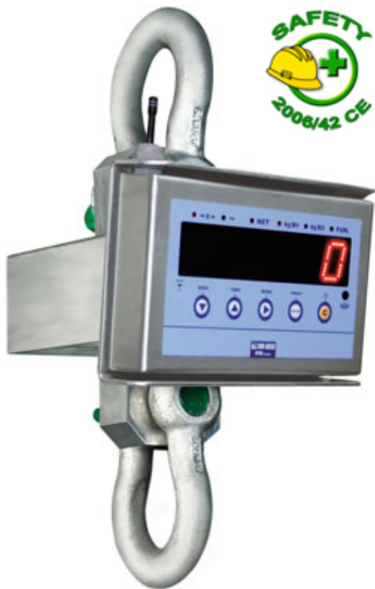
Dinamómetro MCW09 con módulo radiofrecuencia opcional