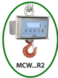
Ganchos pesadores MCW y MCWR2