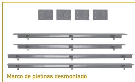
Marco de pletinas desmontado